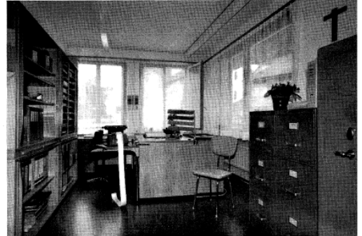
Ortskanzlei und Verwaltung EW und Wasserversorgung