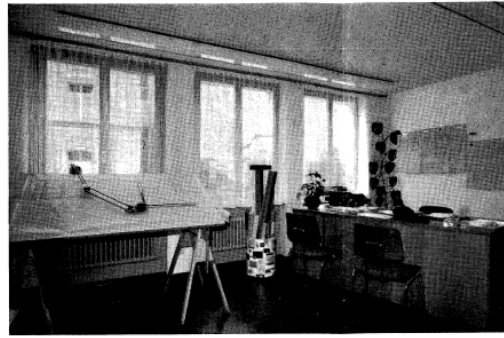
Technisches Büro EW und Wasserversorgung

vollamtlicher Schreiber, Kassier und Einziger erledigten das Rechnungswesen. In dem für ein EW. interessanten, aber sehr arbeitsintensiven Detailverkauf zeigen folgende Abonnentenzahlen die Entwicklung auf: Jahr 1946: Netz Murg = 230 Abo., Netz Flumserberg 99, Jahr 1965: Netz Murg 304 Abo., Netz Flumserberg jedoch 517. Kassabelege beim EW. im Jahr 1946 = 677, Jahr 1965 = 1056, Postcheckbelege im Jahr